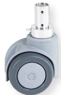
双脚轮 带集成油缸

i HAWE 标准地面锁定套件为您提供最佳匹配的解决方案, 也可以根据客户需求定制解决方案。通过在个性化需求上积累的多年经验, 使我们能够快速高效地落实客户的特殊要求。欢迎前来咨询。